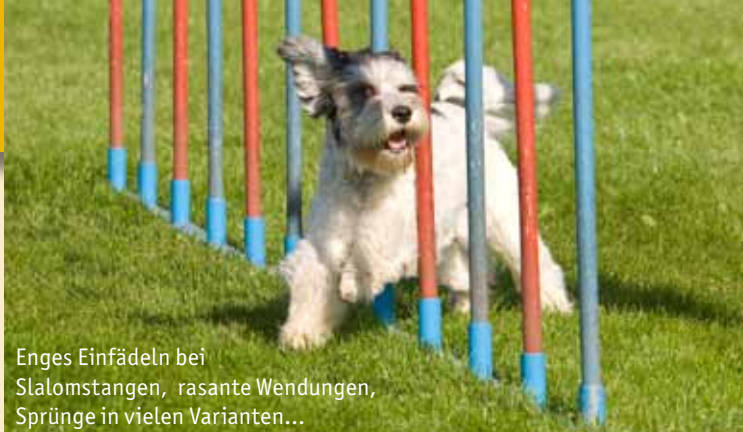
Enges Einfädeln bei Slalomstangen, rasante Wendungen, Sprünge in vielen Varianten...